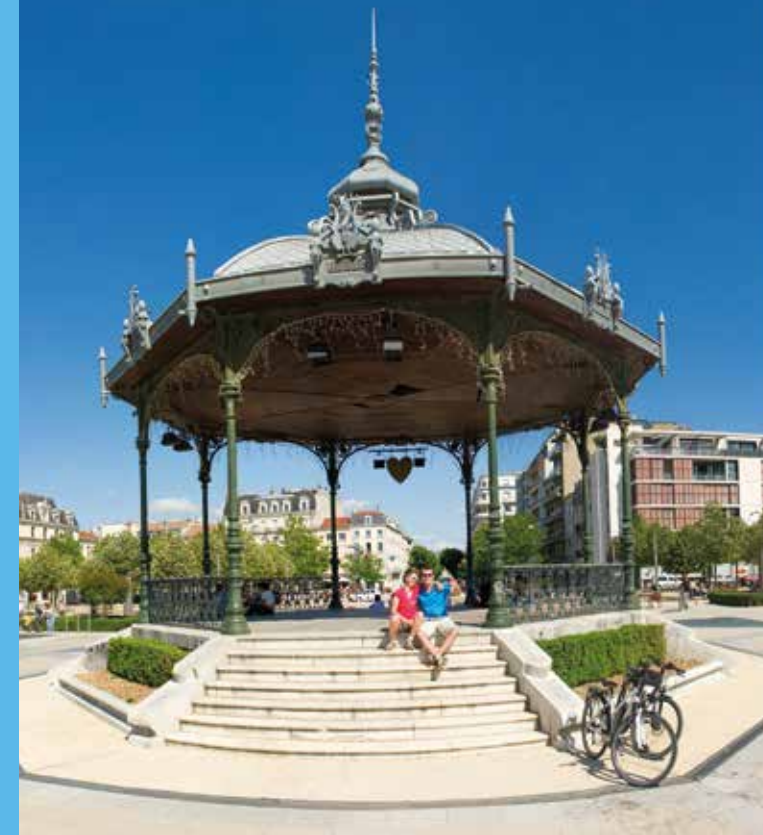
Les Cars de la Région Auvergne-Rhône-Alpes

L : lundi M : mardi Me : mercredi J : jeudi V : vendredi S : samedi DF : dimanche et fêtes